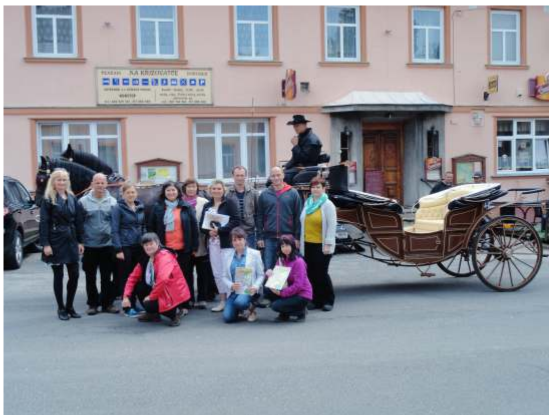
Hodnotitelská komise navštívila naši obec 27. 6. 2013